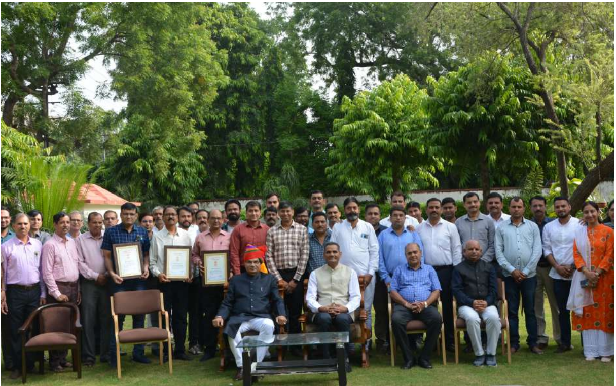
स्वतंत्रता दिवस, 2023 के अवसर पर माननीय लोकायुक्त महोदय, सचिव महोदय एवं समस्त अधिकारी / कर्मचारीगण